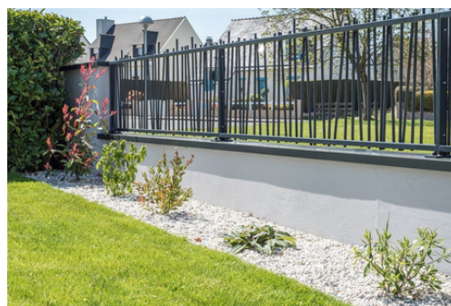
DPC 6 : insertion du projet