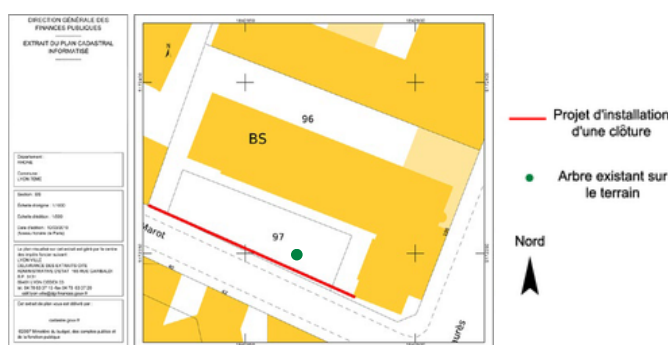
DPC 2 : plan de masse